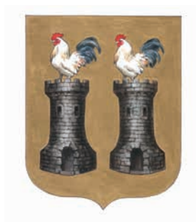
Fig. 8. Armas de los Gallent