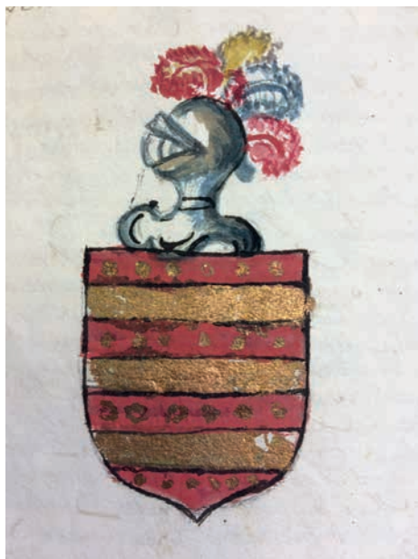
Fig. 2. Armas de Ferrandis, ARV, Real Justicia, libro 26