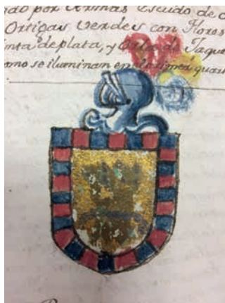
Fig. 5. Armas de Ortizá, ARV, Real Justicia, libro 26