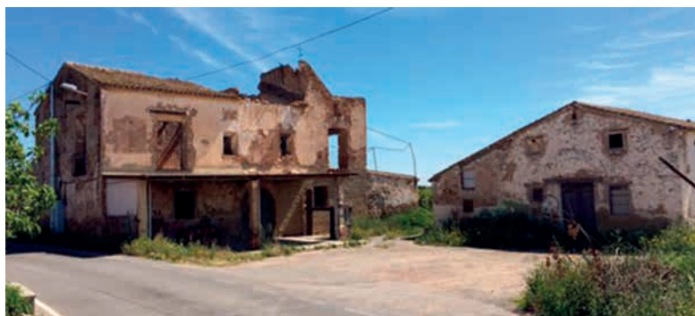
Fig. 7. Ruinas de la alquería de Burgos, Tauladella