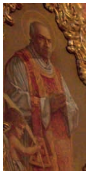
Fig. 9. Beato José Ruiz y Bruixola, parroquia de San Nicolás, Valencia

1936), párroco de San Nicolás en Valencia, presbítero y mártir, beatificado el 11-III-2001 por la Santidad de Juan Pablo II 89 .