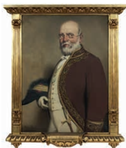
Fig. 10. Antonio Aparisi y Guijarro, I conde de Santa Eugenia