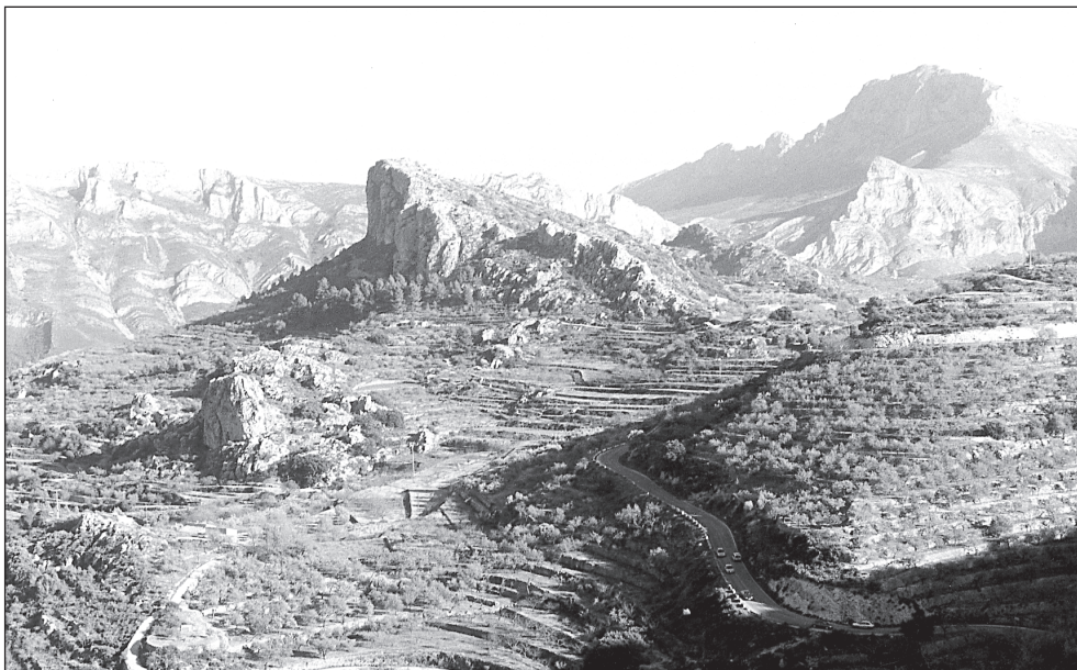
Sa Caseta des Moros i es Seguers, al mig. Al fons, a mà esquerra, ses Penyes de s'Ombria.

expel·lits en 1609. La problemàtica d'aquestes formes és la seua transmissió documental, en molts casos possiblement defectuosa, al llarg dels segles. Si els notaris del segle XVII reproduïen alguns d'aquests noms, no sabem fins a quin punt eren fidels a la seua pronúncia i, a més, ja no tenien el referent del punt de vista autòcton per esmenar-ne les errades. Ja en el segle XVII es perceben, com veurem, algunes mostres ben eloqüents de reinterpretacions partint de l'aparent similitud de determinades seqüències amb algunes formes catalanes.