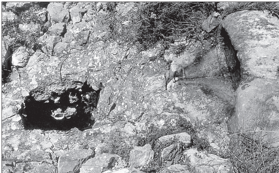
Sa Fonteta d'en Benijam.

Mesquida et cum termino loci Bollulla» [1649/AMG].