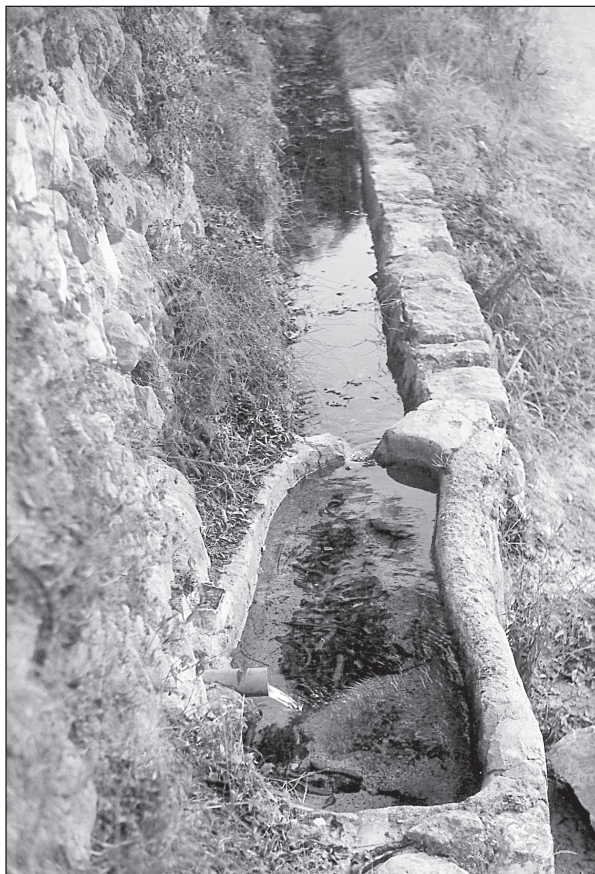
Sa fonteta d'en Mas.

No tota la toponímia anterior a l'expulsió dels moriscs desaparegué de la vall de Tàrbena, un 50% dels topònims que apareixen als documents coetanis de la repoblació són